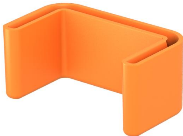
Zaštitna kapica za završetke profila US 3.