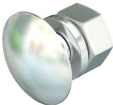
Torban vijak s podloškom i maticom.